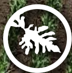
Citrullus lanatus Karkoer

~ insluitend vier moeilik-om-te-beheer onkruide.