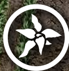
Commelina benghalensis Wandelende jood