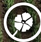
Ipomoea purpurea Purper winde