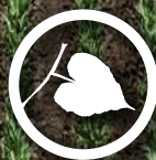
Fallopia convolvulus Wilde bokwiet